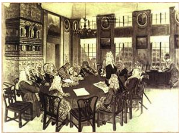
Д. Н. Кардовский «Заседание Сената при Петре I» (1908)

310 лет назад (1711) указом Петра Великого учрежден Правительствующий Сенат – высший орган государственной власти и законодательства Российской империи