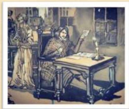
Гоголь пишет петербургские повести (Ф. Москвитин)

В 1830-1840 годах были написаны Николаем Васильевичем Гоголем такие повести, как: «Шинель», «Нос», «Невский проспект», «Записки сумасшедшего, изображающие Петербург «во всей его красе», с чиновниками, с взяточниками, которые были объединены в «Петербургские повести».