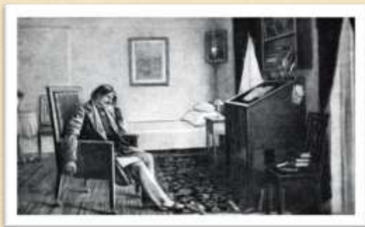
Гоголь за работой в своём кабинете.

В 1830-1840 годах были написаны Николаем Васильевичем Гоголем такие повести, как: «Шинель», «Нос», «Невский проспект», «Записки сумасшедшего, изображающие Петербург «во всей его красе», с чиновниками, с взяточниками, которые были объединены в «Петербургские повести».