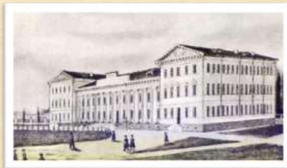
Нежинская гимназия высших наук (1821-1828 годы обучения)