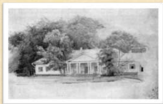
Усадьба Гоголей-Яновских в селе Васильевка

В 1831 году Гоголь знакомится с представителями литературных кругов Жуковского и Пушкина, бесспорно эти знакомства сильно повлияли на его дальнейшую судьбу и литературную деятельность. Благодаря помощи и советам новых друзей, в 1831-1832 гг. Гоголь пишет сборник «Вечера на хуторе близ Диканьки», где обращается к хорошо знакомой ему украинской жизни и фольклору. Также Украина была широко описана в произведении Гоголя «Тарас Бульба». В 1835 – выходит сборник «Миргород», в этом же году приступает к созданию «Мертвых душ» и «Ревизора». В 1836г. состоялась премьера комедии «Ревизор» в театрах Москвы и Петербурга.