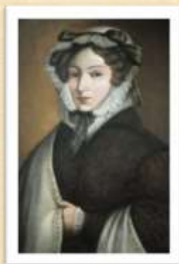
Отец Гоголя Василий Афанасьевич и мать Мария Ивановна