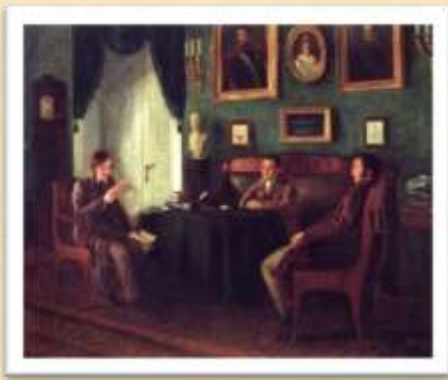
Гоголь и Жуковский у Пушкина в Царском Селе. (Худ. П. Геллер. 1910 г.)