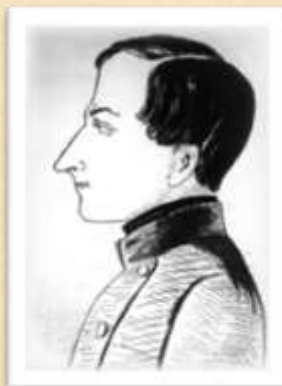
Н. Гоголь – гимназист. Портрет работы неизв. Художника. 1827г.